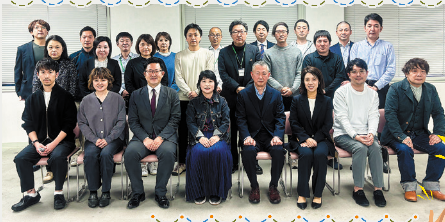
※フォローアップ研修終了後撮影。