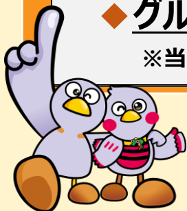
埼玉県マスコット 「コバトン」「さいたまっち」

※当日は、ZOOMの機能を活用した参加者におけるグループディスカッションを予定しています。