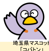
埼玉県マスコット 「コバトン」