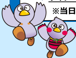
埼玉県マスコット「コバトン」「さいたまっち」

※リアルタイム開催のため、昨年度から変更している点がありますのでご注意ください。